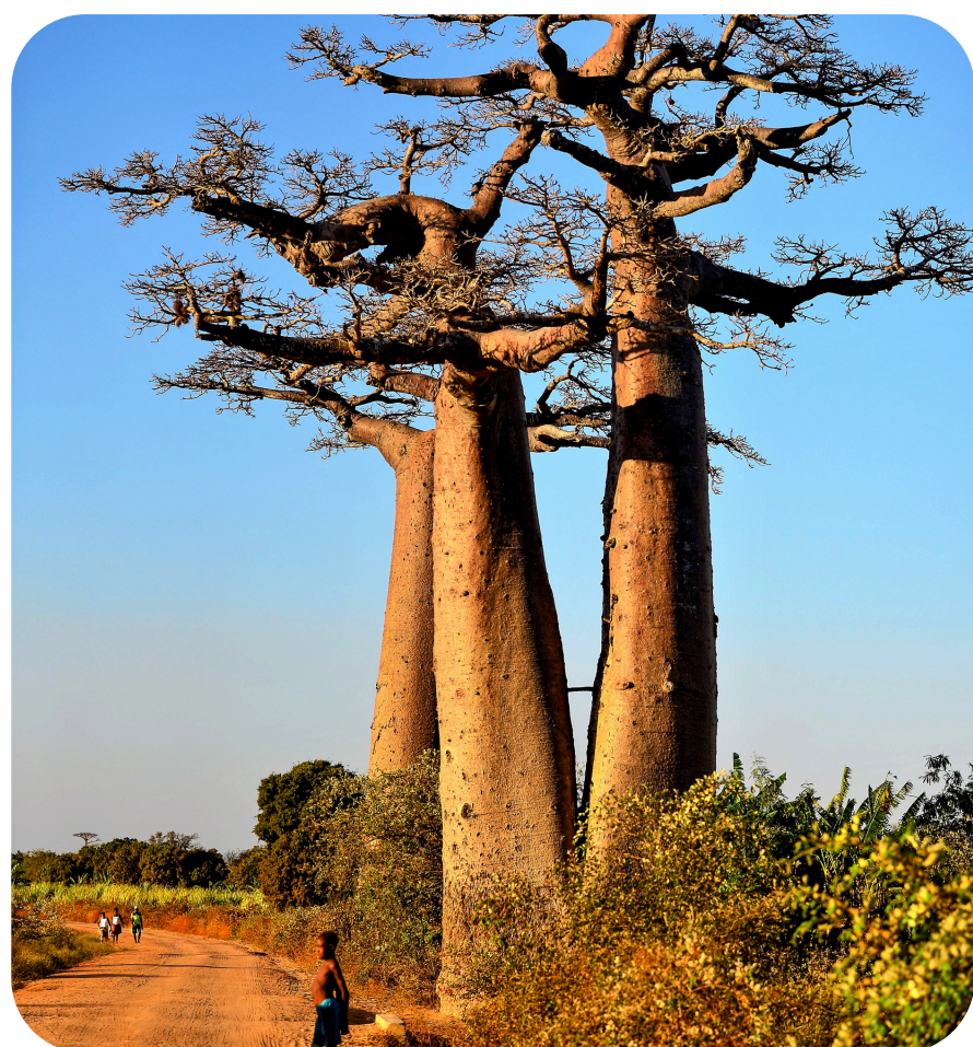
Baobaby na Madagaskaru