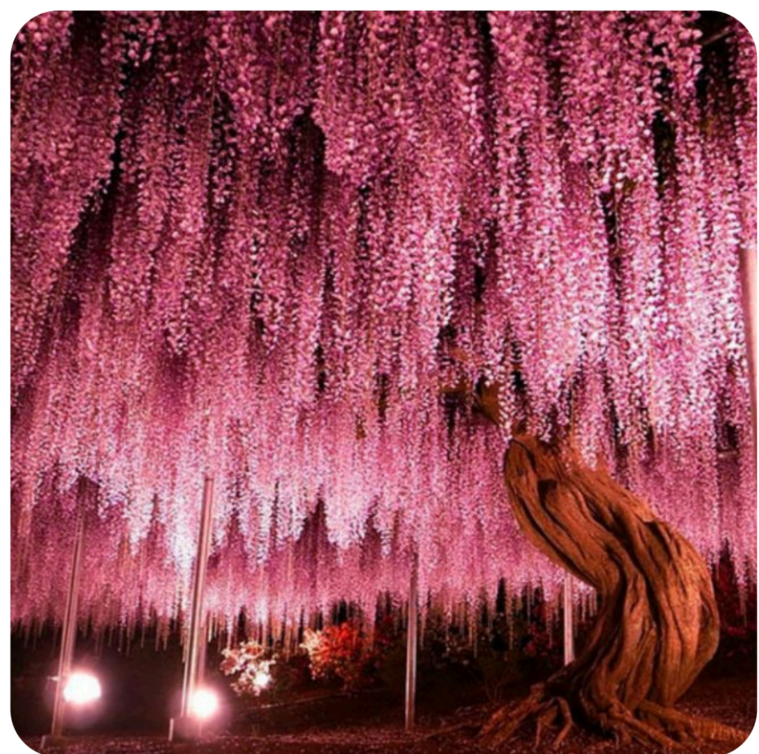
Wistaria v Japonsku