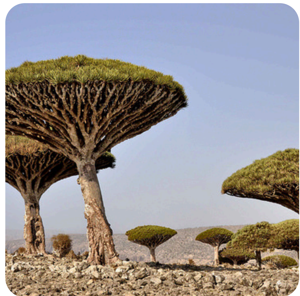
stromy Dračí krve, Jemen